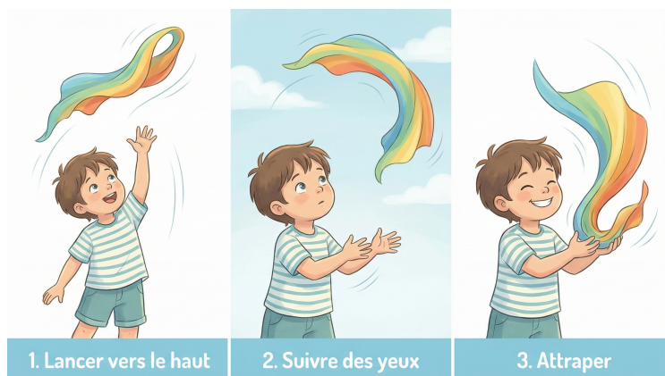
Séquence des étapes

« Pour finir, faisons danser nos foulards. Ils font des vagues... des cercles... et se posent doucement au sol, comme des feuilles d'automne. »