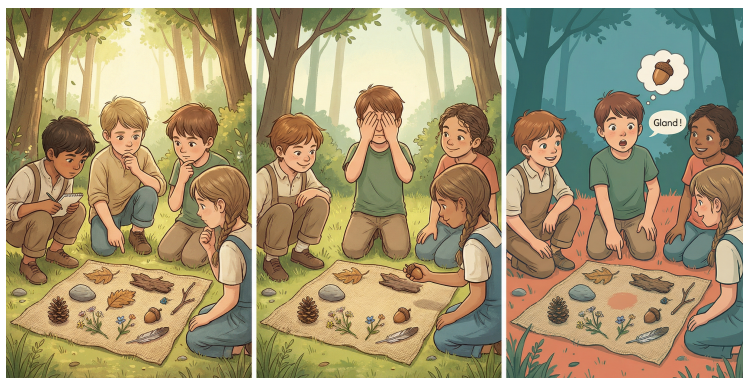
1. Observer et mémoriser

« Maintenant, regardez et touchez tous les trésors. Lequel préférez-vous ? Comment vous avez fait pour vous souvenir de leur place ? »