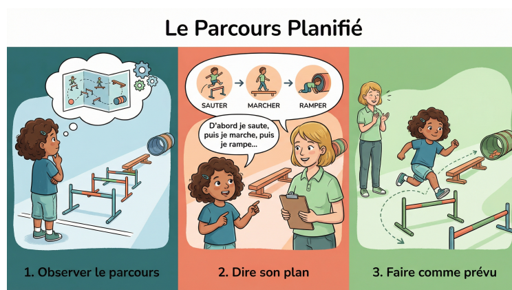
Séquence des étapes

« As-tu réussi à faire tout ce qui était sur le plan ? Qu'est-ce qui était le plus difficile à retenir ? Qu'est-ce qui t'a aidé ? »